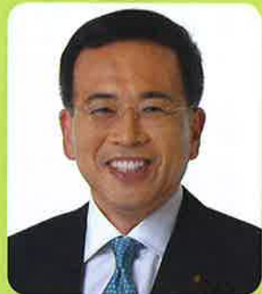
公明党横浜市会議員団 団長

災害時のペット同行避難訓練の促進とともに、毎年中区で行われている「動物愛護フェスタ」を来年度は青葉区など北部方面で開催すべきと質問。市長は「市内全域で検討する」旨を答弁。人もペットも安心の取り組みを進めて参ります。