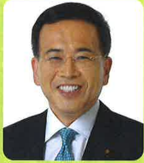
公明党横浜市議員団 団長