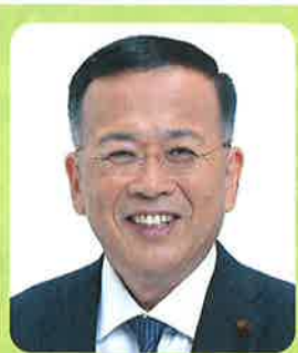
公明党横浜市議員団

1960年に開院してから50年以上にわたり、市民の皆様は医療を提供してきた横浜市民病院は、老朽化などのため現所在地の近くに新病院を建設中で、今年5月に開院が予定されています。