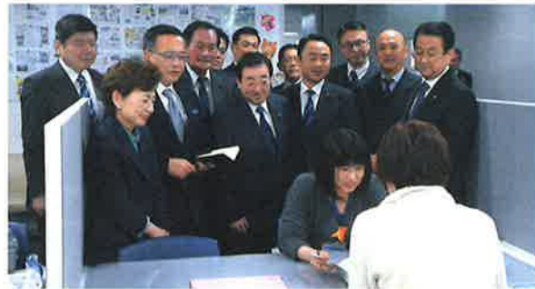
母子保健コーディネーターによる相談支援を視察

その中でも、母子健康手帳交付時の面接・相談や、個々の状況に適した情報提供等を実施し、産前産後の支援の充実を図る母子保健コーディネーターの配置拡充を要望していましたが、令和2年度予算案に新規7区含む全18区への配置を盛り込むことができました。